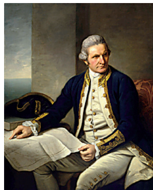
J. Cook im Porträt von Nathaniel Dance-Holland, 1776, National Maritime Museum, London

Zuletzt werden neben diesen neuen, neueren und unbekannteren Lehrstücken und Lehrstückideen im Institut für Vorschul- und Primarschulstufe der Pädagogischen Hochschule Bern natürlich auch bekannte Lehrstücke gepflegt. „Faradays Kerze“ ist ein Evergreen und nicht nur für die Naturwissenschaften, sondern auch für zukünftige Lehrerinnen und Lehrer ein hervorragendes Eingangstor. Aber auch der „Heimatliche Sternhimmel“ oder der „Dorfteich“ sind präsent und geben – selbstverständlich am Schauplatz selbst – verlässlichen Einblick in Arbeits- und Denkweise des Lehrstückunterrichts. •