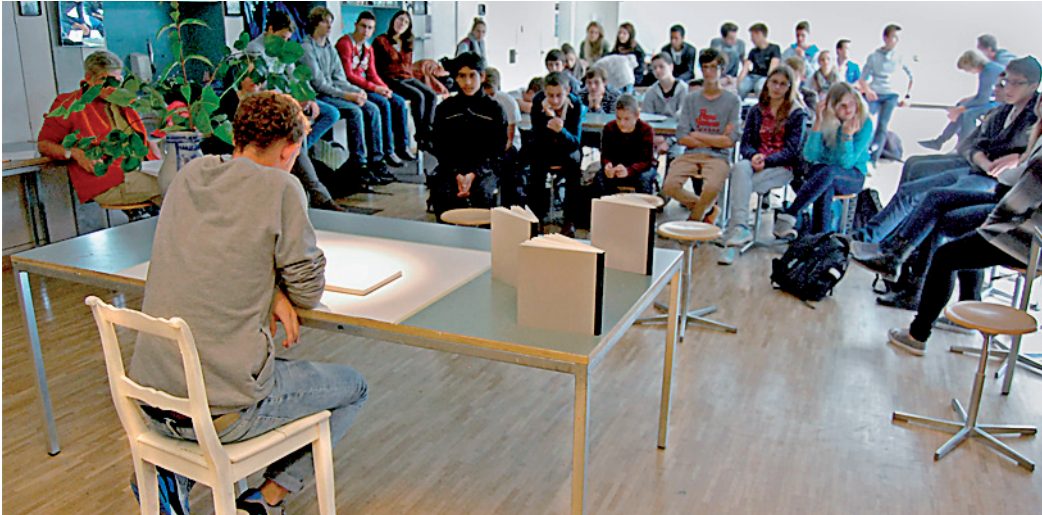
Zum Abschluss: Lesung mit unseren Spaziergangstexten in der Schule

teren Texten zur Thematik des Wanderns, Spazierens, Flanierens. Texte und Skizzen, die aus den eigenen Beobachtungen und Gedanken des Spazierens in der Literaturwerkstatt erarbeitet werden, fügen sich hinzu. Handwerkslehre im Schreiben und Skizzieren, das Entdecken der Charakteristik in der Sprache Walsers, das Spiegeln von äusseren und inneren Welten.