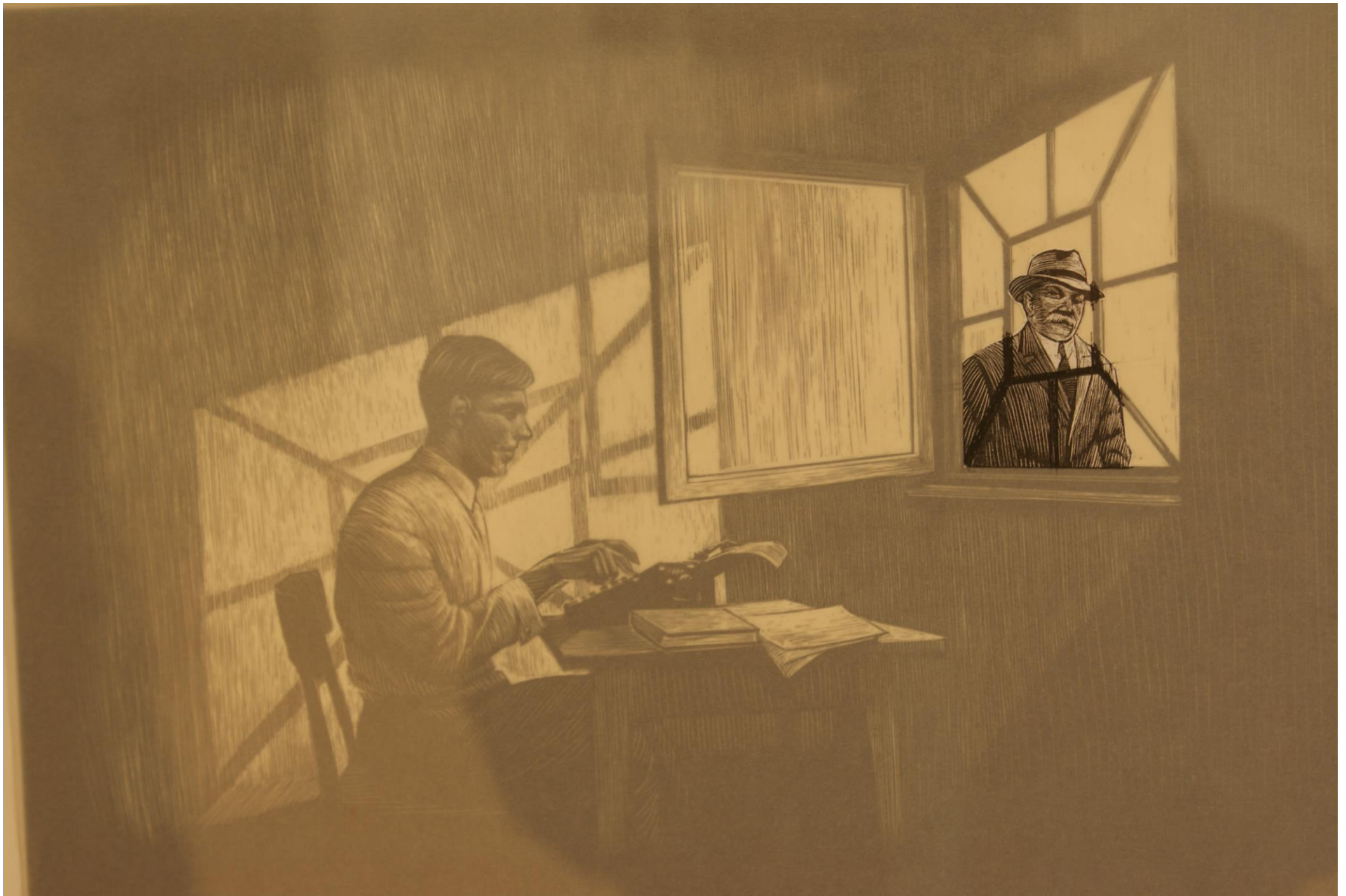
Denkbild von Hannes Binder: Die Genese des Matto-Romans im Moment, wo der Protagonist Wachtmeister Studer auftaucht