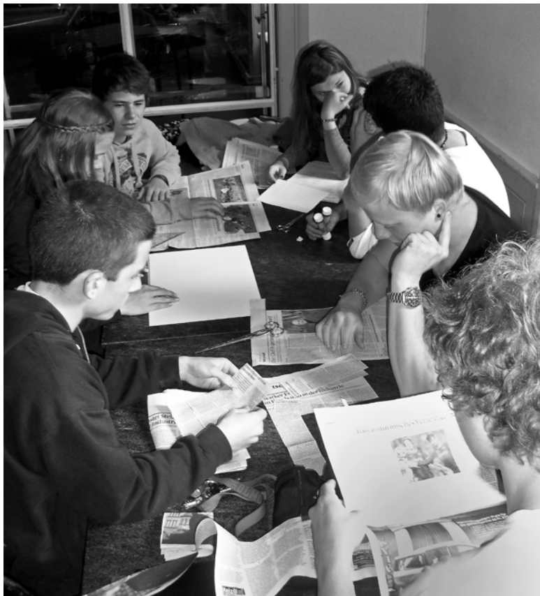
Die Lehrkunst altmodisch? Das Lehrstück „Unsere Abendzeitung“ beweise das Gegenteil, meinte der „Festredner“: Szene aus der SchülerInnen-Redaktion im Lehrstück UAZ.