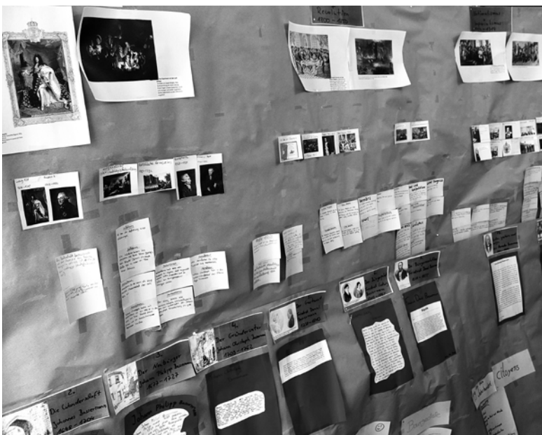
Denkbild zum Geschichts-Lehrstück „Die Bassermanns“, das Gegenstand eines Forums an der Summer School war.

Ja, die Unterschiede sind meines Erachtens teils ganz durchschlagend. Zwar besteht natürlich immer ein gewisses Risiko, dass man sich liebgewonnene Ideen schönredet, wenn aber beispielweise Sechstklässlerinnen im Anschluss an das Pascal-Lehrstück bereits in wesentlichen Zügen das Konzept der bedingten Wahrscheinlichkeit begreifen, das offiziell erst in den gymnasialen Oberstufencurricula auftaucht, dann ist das wohl ein überzeugender Anhaltspunkt dafür, dass die Lehrkunstdidaktik ganz entscheidende Dinge richtig macht. Auch wenn man auf dem Pausenhof mit Schülern ins Gespräch kommt, denen man Monate zuvor die Logarithmen mit Hilfe historischer Rechenhilfsmittel nähergebracht hat, und dabei bei blosser Erwähnung des Wortes "Raster" in völlig mathematikfernem Zusammenhang zu hören bekommt: "Wo sie gerade Raster sagen, muss ich direkt wieder an den Abakus denken!", spürt man, welch nachhaltiges Einwurzelungspotenzial die lehrkunstdidaktische Herangehensweise in sich birgt. Viele ähnliche