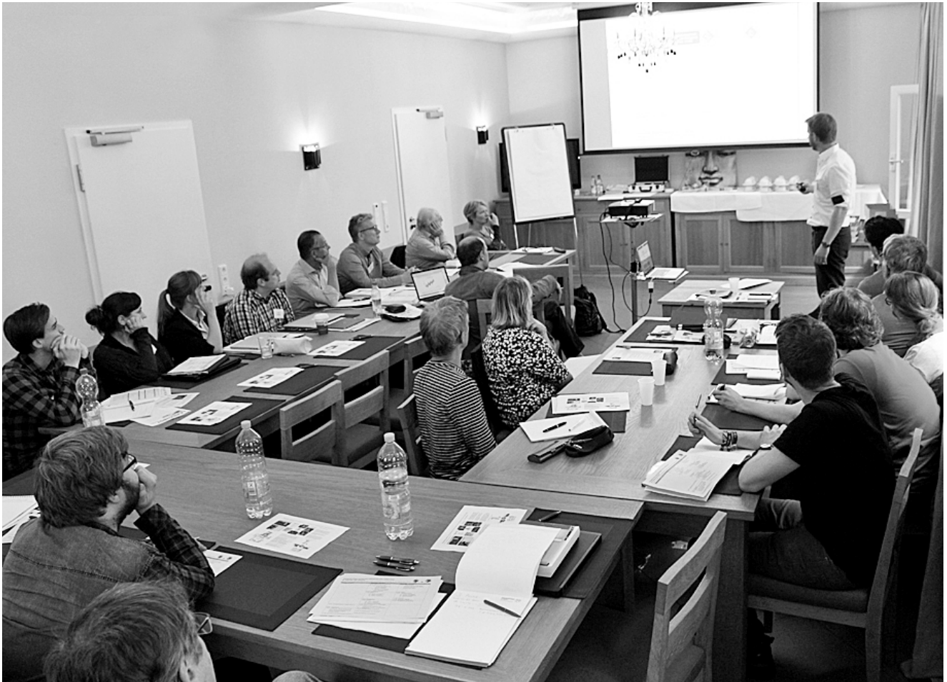
Internationale Beteiligung mit Lehrkräften aus Holland, Deutschland und der Schweiz bei der ersten Summer School der Lehrkunstdidaktik in Heidelberg